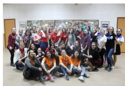
Посвящение в МО и ВО «Ювентис»