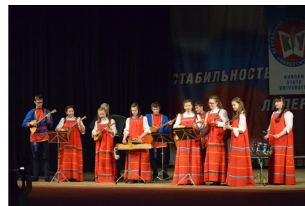
Зауральская студенческая весна