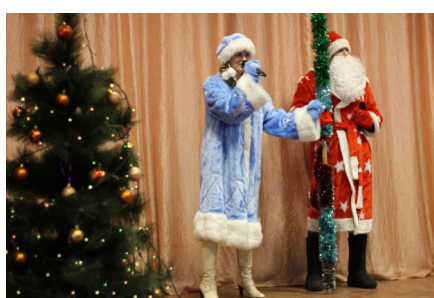
Благотворительный концерт «Луч надежды»