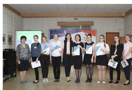
Учрежденческий этап WSR