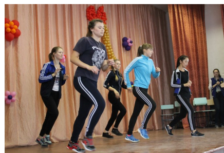
Посвящение в студенты