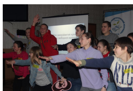
Ночной студенческий форум «Оливье»