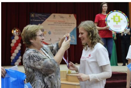
II Региональный чемпионат WSR