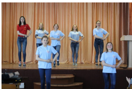
Благотворительный концерт «Луч надежды»