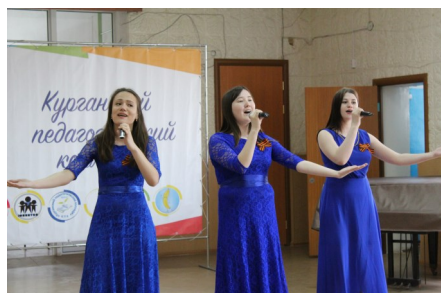
«70+2» – Концерт ко Дню Победы