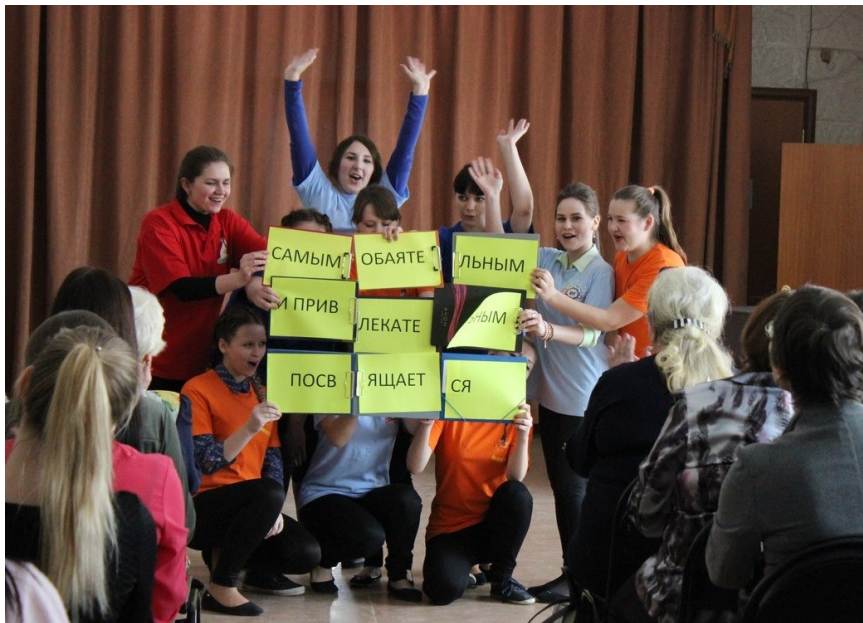
(с праздника в честь 8 марта)