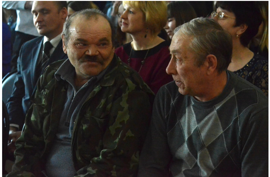
(с праздника в честь 23 февраля)

3. Первый советский номер большевистского журнала для женщин «Работница» вышел 8 марта 1914 года.