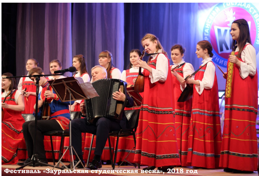
Фестиваль «Зауральская студенческая весна», 2018 год

Я желаю, чтобы наш музей с каждым годом все больше и больше процветал, развивался, рос состав участников и, конечно же, не переставал радовать нас своим творчеством!