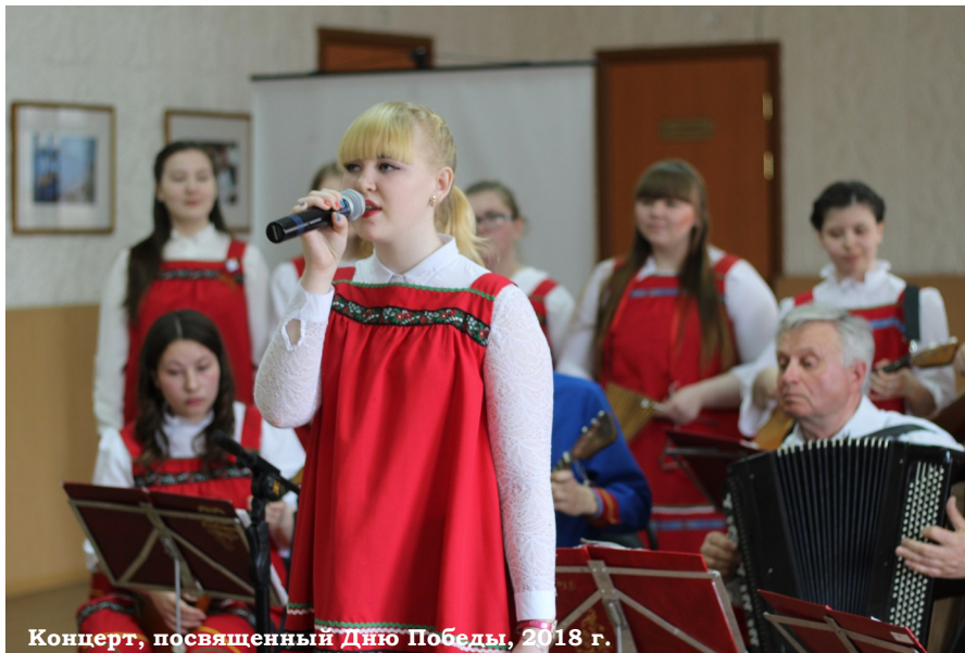
Концерт, посвященный Дню Победы, 2018 г.

За время занятий и выступлений, я научилась правильно дышать во время пения, играть на некоторых инстру-