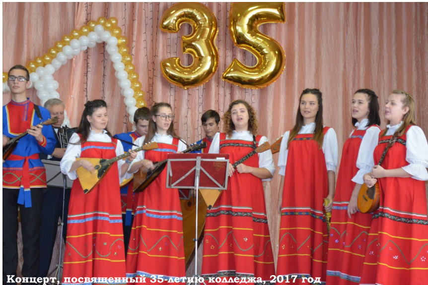
Концерт, посвященный 35-летию колледжа, 2017 год